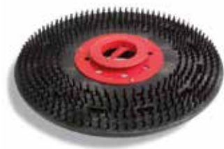
Plateau Flexidrive Ø400mm réf. 606411 (inclus)